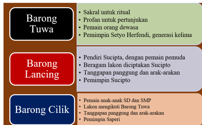
Gambar 2. Tiga grup barong Kemiren

Sucipto, sebagai pendiri dan pemimpin Barong Lancing Sapu Jagat telah menciptakan tujuh lakon, yaitu (1) Geger Cilacap, (2) Pendekar Alas Purwo, (3) Sarjulo Kamandoko, (4) Puspolonggo Edan, (5) Alap-Alap Bojonegoro, (6) Satrio Alas Sembulungan, dan (7) Laire Maheso Anggoro (Anoegrajekti, 2016). Berkat inovasi yang dilakukan, Barong Sapu Jagat telah mendapatkan kesempatan pentas di Taman Mini Indonesia Indah dan di Salihara, milik budayawan Gunawan Muhamad. Kesempatan tersebut sekaligus berfungsi sebagai ajang promosi seni dan budaya Banyuwangi kepada masyarakat Indonesia. Bagi para pelaku seni Barong Lancing, kesempatan menyelenggarakan pergelaran di luar wilayah Banyuwangi menjadi penguatan dalam menekuni seni tradisi Banyuwangi. Dengan demikian, dari segi keberlangsungan dan keberlanjutan seni tradisi barong memiliki pola estafet yang sistemik.