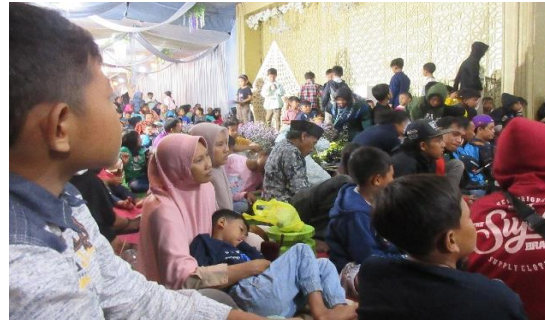
Foto 2. Pergelaran barong panggung dalam rangka pernikahan di Kemiren (Kiri). Penonton memadati halaman depan panggung yang didekorasi menggunakan terop (Kanan)

Foto 2 kiri memperlihatkan pertunjukan barong panggung pada adegan ja'ripah , yaitu seorang gadis yang memiliki bintang piaraan barong. Para penonton lazimnya sudah hafal dengan isinya karena adegan dan ceritanya sama. Modifikasi terbatas pada improvisasi dialog dan lelucon yang dibawakan. Meskipun demikian, seni pertunjukan yang dikembangkan berbasis ritual ini tetap diminati dan disenangi oleh masyarakat pendukungnya. Minat penonton tampak pada foto 2 kanan yang memperlihatkan jumlah penonton yang memadati halaman depan panggung yang diperkirakan sekitar enam ratusan penonton.