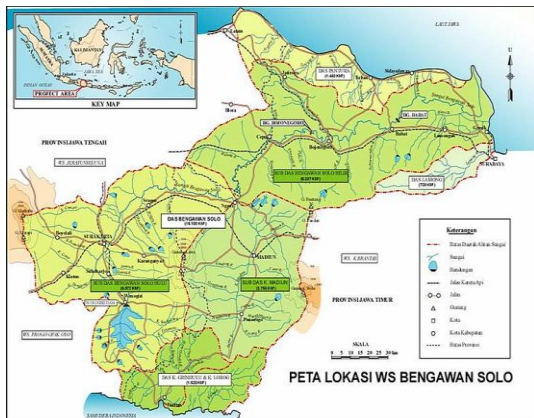
Gambar 1. Peta Bengawan Solo

berakhirnya era karesidenan. Akan tetapi, bagi masyarakat yang kurang memahami konteks politik administratif dan tidak memahami persoalan sumber mata air Bengawan Solo, dapat dipastikan membenarkan konsepsi ruang yang diciptakan oleh Gesang melalui lagunya. Lebih khusus bagi para penggemar lagu “Bengawan Solo” yang tidak memahami konteks administratif Kota Solo. Gambar 1 adalah peta Bengawan Solo yang menunjukkan lokasi sumber mata air berada di Kabupaten Wonogiri (Sumber: https://upload.wikimedia.org/wikipedia/id/thumb/7/78/Lokasi_WS_Bengawan_Solo.jpg/800px-Lokasi_WS_Bengawan_Solo.jpg . Diperoleh tanggal 25 Juli 2020).