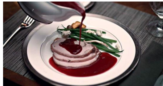
Gambar 4 "Pork" Loin ( Hannibal Season 1 Episode 1 )

di sebelah kanan), namun nyatanya sudah banyak dibicarakan sejak Mei 2014 (lingkaran merah di sebelah kiri). Negara nomor satu yang paling banyak membicarakan buku ini adalah United Kingdom, diikuti dengan Jerman, Amerika, dan Rusia. Hal ini berarti, proses memasak dalam Hannibal telah menarik banyak pihak dan terbukti dari animo masyarakat dalam spesifik mencari buku yang membicarakan soal resep dan informasi lain yang ada di dalam serial televisi tersebut. Serial televisi Hannibal berhasil membuat karakter Hannibal menjadi sosok kanibal paling cerdas dan berkkelas: semakin mengaburkan batas antara self dan the other . Gambar 4 adalah salah satu contoh hasil masakan Hannibal.