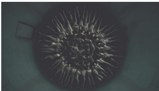
Gambar 5 The Human Palette ( Hannibal Season 2 Episode 2 )

yang direncanakan dan disorot dengan sinematik yang bagus dan detail. Hannibal tidak pernah begitu saja membunuh korbannya selayaknya binatang, namun ia menganggap korbannya sebagai suatu mahakarya seni. Sisi estetika yang ditangkap dengan teknik sinematik ini dengan detail dieksplorasi di serial televisi pada setiap scene pembunuhan karya Hannibal. Tidak lupa, Hannibal menunjukkan rasa hormatnya kepada para korbannya dengan menunjukkan sisi kecantikan dari tubuh yang sudah tidak bernyawa. Misalnya, The Human Palette di Season 2 yang menunjukkan beberapa orang mati dalam berbagai warna kulit ditempatkan dalam lingkaran atau dengan menggantung mereka dan membuat sayap dari kulit punggung mereka yang telah disayat lebar, layaknya malaikat, atau dengan mengeluarkan semua isi perut (Hannibal sangat suka bagian organ dalam daripada memakan daging luar. Dia sangat sering memasak dengan menggunakan organ dalam seperti hati, jantung, usus, dan paru-paru) dan mengisi perut yang telah kosong tersebut dengan berbagai bunga.