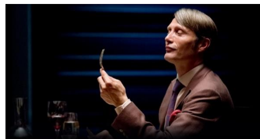
Gambar 2 Hannibal Menikmati Makanannya (Hannibal Season 1 Episode 2)

Jikalau Dr. Hannibal Lecter pernah menulis sebuah buku masak, buku itu akan berjudul, How to Cook Everyone . Tidak hanya dalam membunuh orang dan memanen organ tubuh mereka, tapi cara Hannibal memperlakukan daging mereka juga mempertimbangkan setiap aspek estetika. Setiap makanan disiapkan dengan hati-hati dan dia seperti seorang seniman makanan yang bekerja sangat keras untuk memberi mereka tampilan yang menarik. Bagian food porn ini adalah bidang yang tidak dieksplorasi dalam buku dan yang ditawarkan oleh serial TV.