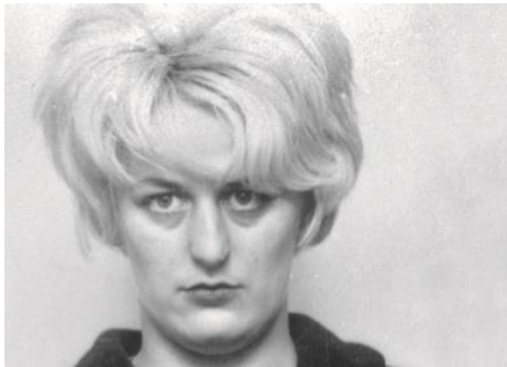
Gambar 1 Foto Mira Hindley dalam Situs Daily Telegraph

wajahnya yang terpampang pada salah satu media berita.