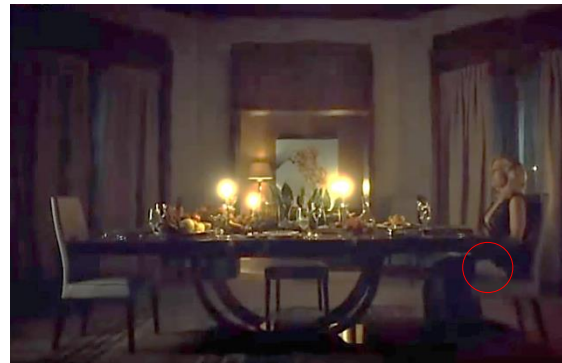
Gambar 8 Bedelia dengan Kaki yang Telah Diamputasi

Namun tampaknya, kekhawatiran banyak pihak tentang bergabungnya Will dan Hannibal berpotensi menjadi sebuah kenyataan. Muncul sebuah adegan di akhir kredit episode terakhir di Season 3 yang memperlihatkan Bedelia duduk di sebuah ruangan dengan dua kursi kosong, seperti pada Gambar 8.