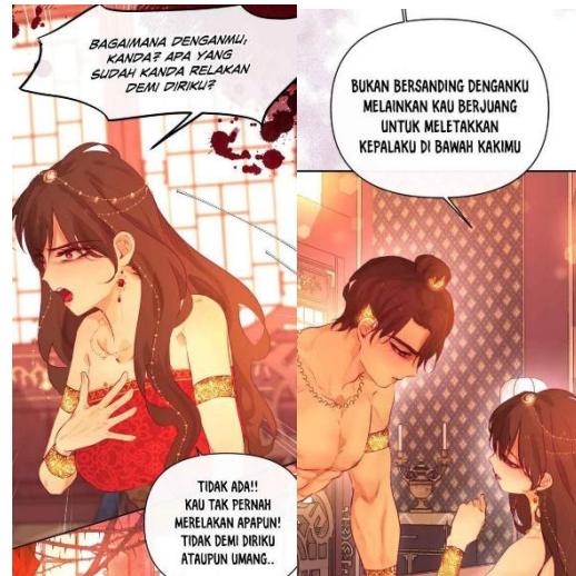
Gambar 13 dan 14 Perdebatan Dedes dan Arok

Berdasarkan konsep utama teori wacana kritis Sara Mills, yaitu analisis posisi subjek dan objek di dalam teks (Mills, 1998), posisi subjek di adegan ini diperankan oleh Dedes. Hal tersebut ditunjukkan melalui adegan Dedes yang terus berbicara dan melemparkan kata-kata tajam kepada Arok sebagai salah satu upayanya dalam mencari keadilan dan menolak tunduk di bawah kuasa Arok. Dedes yang berani dan tidak ingin dikuasai oleh siapapun mengatakan kepada Arok bahwa Arok tidak mencintainya, tetapi mencintai kekuasaan. Di tengah perdebatan, Arok ditikam oleh orang tidak dikenal yang akhirnya diketahui sebagai orang suruhan Anusapati, yaitu anak pertama Dedes, sehingga berakhir terbunuh di hadapan Dedes.