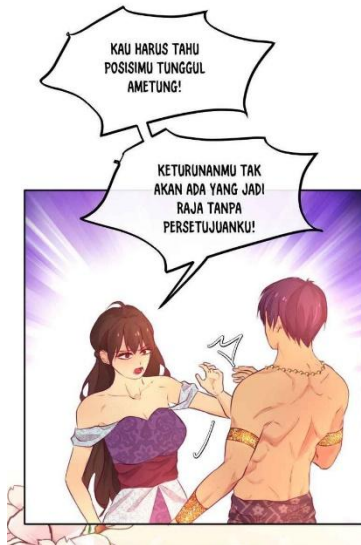
Gambar 8 Dedes Mengancam Tunggul Ametung

Hal tersebut sejalan dengan salah satu karakteristik analisis wacana kritis, yaitu kekuasaan (Eriyanto, 2011). Perbuatan Dedes yang memperingati posisi Tunggul Ametung merupakan bentuk kuasa Dedes berupa ancaman sekaligus perintah agar Tunggul Ametung tidak melewati batas. Dedes menunjukkan dominasinya melalui dua simbol, yaitu penolakan berupa tepisan tangan dan kalimat ancaman seperti kutipan yang sudah disertakan di atas. Meski begitu,