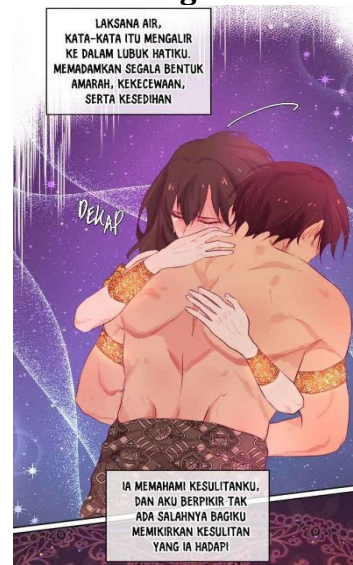
Gambar 2 Arok memeluk Dedes di Taman Larangan

Jiwa asli Dedes diceritakan melalui mimpi Mita yang bertemu Dedes dari masa lalu. Ketika Mita berada di tubuh Dedes, jiwa Dedes menyampaikan kilas balik dari lini masa pertama kepada Mita melalui mimpi saat raga Dedes yang sedang diperankan Mita sedang tertidur. Dari mimpi yang berisi kilas balik kehidupan Dedes di lini masa pertama, terlihat bahwa tokoh Dedes memiliki sifat yang kompleks dan tidak tunggal. Dedes digambarkan sebagai sosok yang kuat dan berani dalam mengambil keputusan-keputusan tertentu, khususnya ketika berkaitan dengan posisi dan perannya dalam struktur kekuasaan. Namun, pada saat yang sama, Dedes juga diperlihatkan memiliki kerentanan emosional yang membuatnya mudah dimanipulasi, terutama ketika berhadapan dengan tokoh Arok. Hal ini diungkapkan melalui monolog dari sudut pandang Dedes setelah berbincang dengan Arok di taman Larangan.