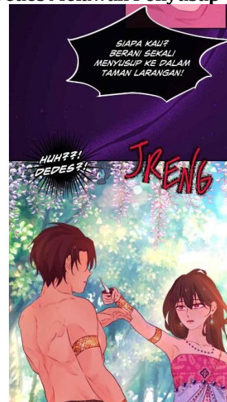
Gambar 3 Dedes Melawan Penyusup

Selain itu, gambaran keberanian Dedes dan sifatnya yang tidak ingin dikuasai pihak lain juga diilustrasikan di episode 18 ketika Dedes sedang bicara berdua dengan Tunggul Ametung di dalam kamar. Adegan ini terjadi di lini masa pertama saat Dedes dan Tunggul Ametung baru menikah. Dedes merasa bahwa para putri di Keputrian Pakuwon Tumapel merasa cemburu karena Dedes sebagai orang baru justru menjadi Prameswari Tunggul Ametung. Hal tersebut digambarkan melalui monolog