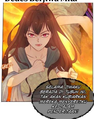
Gambar 6 Dedes Berjiwa Mita

Jika dilihat melalui aspek visual, ekspresi wajah dengan alis menukik ke dalam