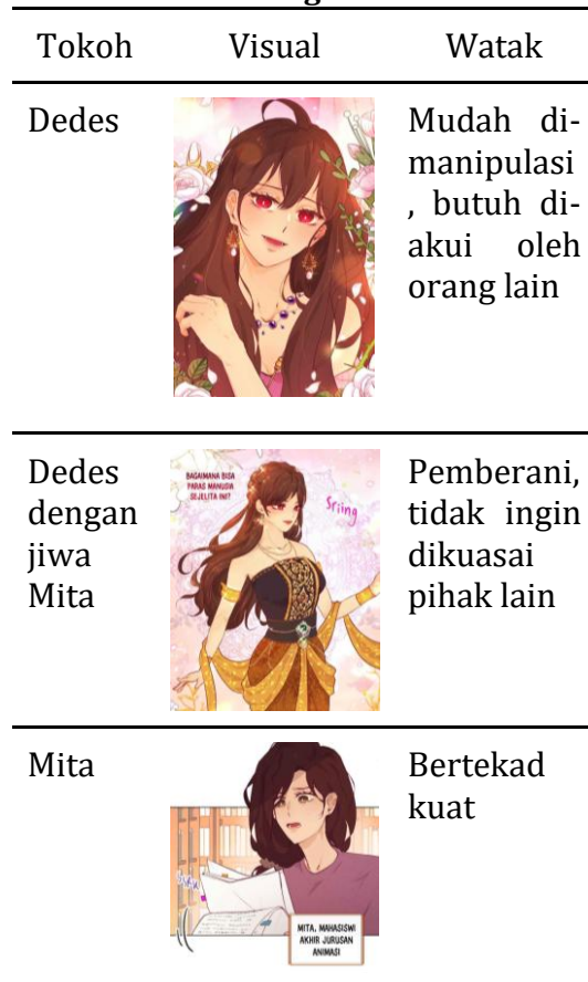
Tabel 1 Perbandingan Tokoh

Dedes dan Mita pun sangat berbeda, terutama dalam ciri fisiknya. Mita merupakan mahasiswi perguruan tinggi dengan fisik dan paras yang digambarkan biasa saja, sementara Dedes merupakan seorang gadis yang digambarkan cantik jelita. Ketika akhirnya Mita masuk ke dalam tubuh Dedes di masa lalu, meskipun secara fisik sama, Mita tetap memiliki sifat berbeda dan cenderung bertolak belakang dengan Dedes. Perbandingan perbedaan ciri fisik dan karakter antara Dedes dan Mita dilampirkan dalam tabel berikut,