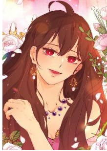
Gambar 1 Tokoh Dedes

Kecantikan Dedes disebut mampu membuat laki-laki manapun yang melihatnya langsung jatuh hati. Di dalam ilustrasi webtoon , Dedes digambarkan memiliki rambut panjang berwarna cokelat dengan mata berwarna kemerahan dengan bulu mata yang lentik. Penampilan Dedes dipercantik dengan perhiasan seperti anting di telinga dan kalung yang menghiasi lehernya. Selain digambarkan melalui unsur visual, deskripsi fisik Dedes juga digambarkan dengan unsur pembauan melalui monolog tokoh Arok di dalam hatinya ketika pertama kali bertemu Dedes di episode 9.