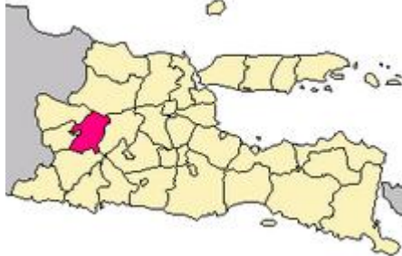
Gambar 2: Tempat tinggal Tulus Setiyadi

Berdasarkan peta tersebut, wilayah tempat tinggal Tulus Setiyadi berada di Jawa Timur sebelah barat. Wilayah ini berbatasan dengan Jawa Tengah, khususnya Kota Solo. Dalam peradaban kuno di Pulau Jawa, khususnya era Mataram kuno, Solo pernah menjadi pusat pemerintahan (Widodo et al. , n.d.). Warisan budaya tersebut masih dipertahankan hingga sekarang dengan keberadaan Keraton Solo. Posisi ini berpengaruh pada lokasi tempat tinggal Tulus yang berbudaya Jawa era Mataraman. Lokasi menentukan cara manusia berbahasa. Tulus Setiyadi dan masyarakat di sekitarnya menggunakan bahasa Jawa khas Mataraman yang dipertahankan hingga sekarang. Salah satu kekhasannya adalah sopan santun yang didasarkan pada stratifikasi sosial dalam masyarakat (Arrini et al. , 2023). Stratifikasi tertinggi menuntut penggunaan bahasa Jawa krama halus. Penutur bahasa Jawa krama halus semakin lama semakin berkurang (Widiana et al. , 2020). Penuturnya tidak banyak dan yang mau mempelajarinya juga sedikit. Meskipun demikian, penggunaan bahasa ini seringkali digunakan dalam acara tradisional seperti perkawinan, khitanan, syukuran, dan bersih desa (Hernandez-Barraza et al. , 2019). Posisi yang langka inilah yang diambil oleh Tulus dalam masyarakat. Kemampuan Tulus dalam berbahasa Jawa krama halus membuatnya dilibatkan dalam berbagai kegiatan