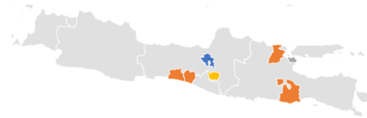
Gambar 3: Pemetaan penelitian tentang Tulus Setiyadi

Selain menganalisis wilayah penelitian, peneliti juga menganalisis tema-tema yang sering muncul tentang penelitian terhadap Tulus Setiyadi. Peneliti menggunakan bantuan aplikasi VOS viewer untuk mengelompokkan kecenderungan tematis penelitian tentang Tulus Setiyadi.