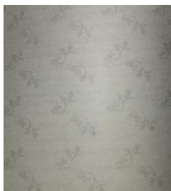
Gambar 2 Data simbol metafiksi

Simbol tersebut muncul dalam novel, masing-masing pada halaman 50, 80, 110, 130, 152, 184. Halaman ini digunakan pada tujuh kisah yang secara berurutan, masing-masing berjudul Bocah Cahaya , Telaga , Sepasang Mata yang Membakar , Semacam Roh dalam